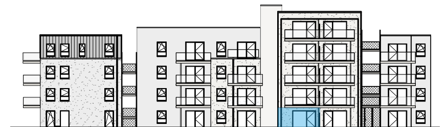
gevel Broekweg 1/500