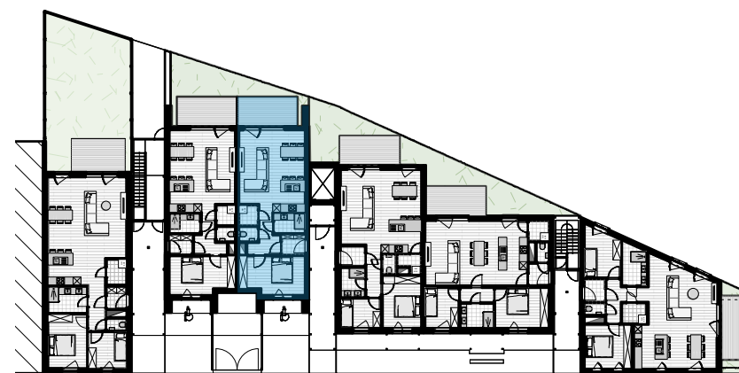
grondplan gelijkvloers 1/500